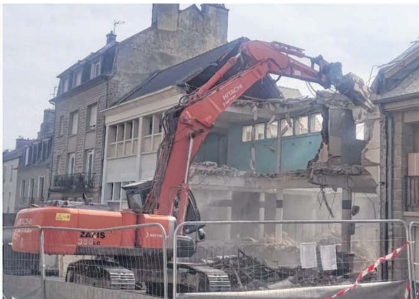
De la pose de canalisations à la démolition (comme ici rue Jules Ferry à Fougères), la Sotrav a plusieurs cordes à son arc.